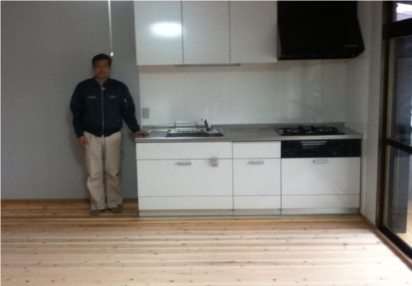
これは内緒ですが、このキッチン ニトリより安いです。ハイ！ とあるメーカーに特別に頼んで入れてもらいました。