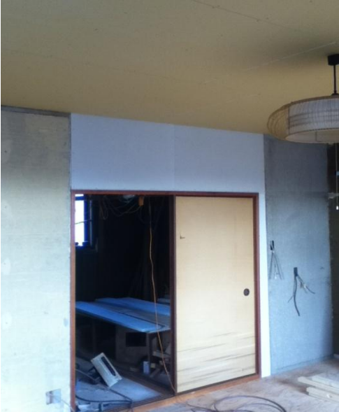
ケチケチリフォームです。 使えるものは、なんでも再生 建具・柱・鴨居などなど

昨年の年末にバタバタと始めました実家のリフォームが2月中旬に完成しました。実は、このリフォームを始める事になったのは、父親が高齢のため、妹夫婦が父と一緒に住む事を決めた事がきっかけとなりました。父は、特設介護が必要なわけではありませんが、母を亡くしてから、一人暮らしをされており、寂しいのではないかと、私のいらぬお節介から話がトントンと進んで、改装することになりました。本来なら長男である私が一緒に住むのが筋？なのかもしれませんが、子供の事や今住んでいる家の事など事情もあり、妹に相談をしてOKをもらった次第です。本音を言うと、父も私の嫁さんより実の娘の方が、気を遣わなくて済むし、妹夫婦も家賃を払わなくていいというメリットもあり丸く収まった訳ですが・・・ ただ、妹の旦那は他人であり、マスオさん状態になるわけですから、反対されるんじゃないかと心配しましたが、気さくで優しい性格の持ち主で、快諾してもらいホッとしております。そんな訳で、3月から、父と妹夫婦の同居生活が始まります。私も今まで以上に実家に立ち寄る機会が増え、父と息子というなんとなく照れのある関係が、妹夫婦によって溶け合う事になれば嬉しいなと思います。