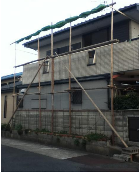
今時、丸太足場??? 言わないで下さい、これも 節約、ケチケチリフォームです。