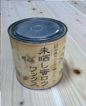
でも、仕上げはバッチリこだわっています。 壁紙は土佐和紙で調湿効果をあげ、室内はいい空気環境に 床板は杉の無垢フローリング、蜜燻ワックスでつや出し 冬でも足元が冷たくありません。