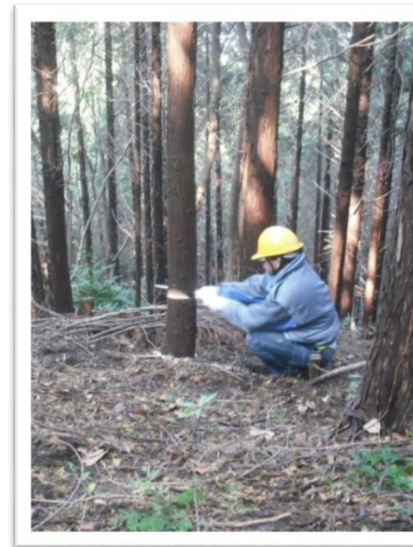
いざ！倒す方向を決めて切ります。

第一弾の里山ハイキングは、台風18号の影響で予定していた登山道が崩落して危険な状態になりましたので、残念でしたが中止に致しました。今回秋も深まりました11月16日に第二弾を行いました。交野山の松林で間伐体験です。ボランティアで里山の管理を行っている『ゆうゆう会』の指導で安全に楽しくできました。間伐は残す木の成長を良くすると共に、里山に棲む動植物の生態系を維持する為、洪水や山崩れの起りにくい山にする為、必要な作業です。