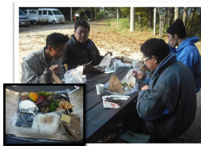
作業のお楽しみ、お昼の弁当タイム。