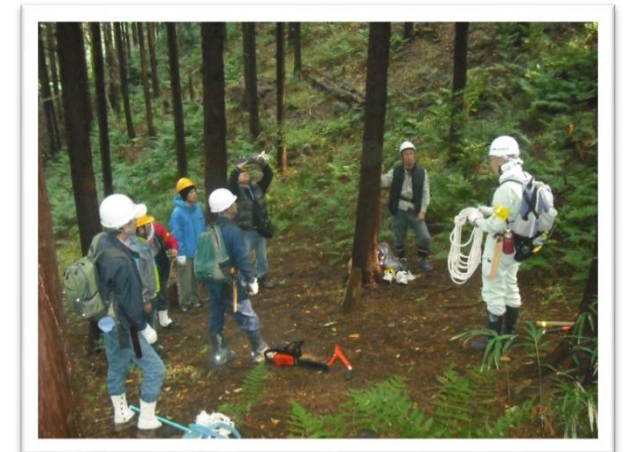
伐採前に手順を打合せ。