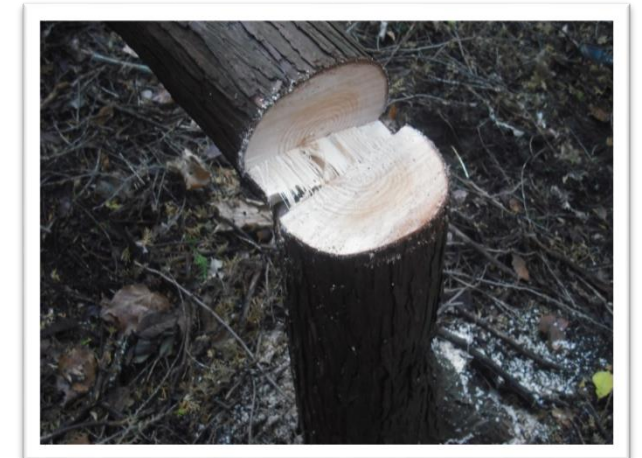
なかなかの切口、松のいい匂いがします。